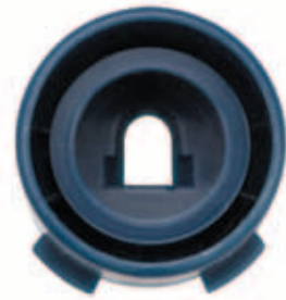
Yağmur perdesi nozulunun önden görünümü Yağmur perdesi nozulunun arkadan görünümü