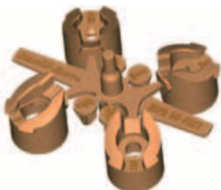
Dört nozullu bir nozul takımı